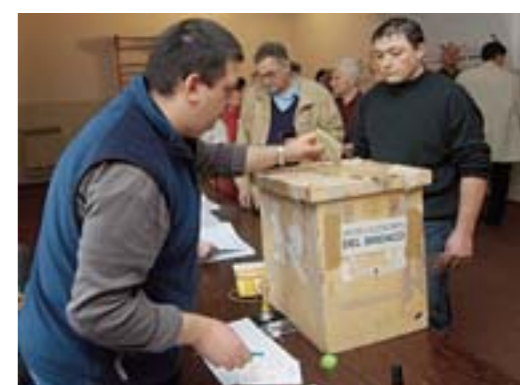
IMMINENTE È per l'8 maggio l'appuntamento con le urne

Una campagna elettorale da centoventimila euro Caccia ai voti via telefono