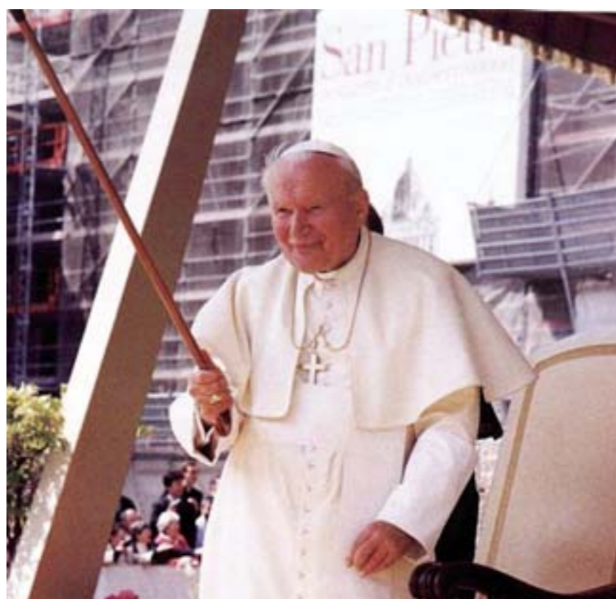
A DOPPIO FILO Un legame profondo quello che legava i credenti trentini a Giovanni Paolo II

È sempre in questa direzione il Papa chiamò in causa anche il movimento della Cooperazione ricordando che «mitigò le difficoltà economiche della popolazione e la orientò, con la guida di sapienti sacerdoti e laici, sulla via della solidarietà». Accoglienza e solidarietà, dunque. Ma anche «sobrietà e intraprendenza»: ecco i punti cardinali che dieci anni fa Giovanni Paolo II fissò per il Trentino. Oggi ci dice che è necessario recuperare al più presto quei valori di riferimento.